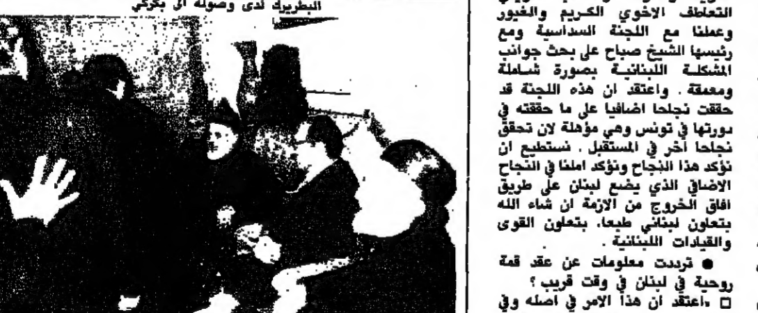
البطيريك لدى وصوله الى بكركي

صفير في بكركي: اللجنة متفهمة للموضع والاجواء كانت ايجابية